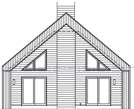
EXTÉRIEUR - AVANT