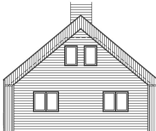
EXTÉRIEUR - ARRIÈRE